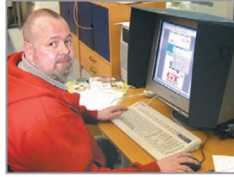
Johan Nise Digitaldruck, JMS Mediasystem

„PrintShop Mail unterstützt viele Formate und alle uns zur Verfügung stehenden Ausgabeoptionen. So haben wir alle Möglichkeiten für personalisiertes Drucken. Es ist auch ein großer Vorteil, dass wir unsere Mitarbeiter leicht im Umgang mit dem Produkt schulen können und damit sehr professionelle Ergebnisse erzielen.“